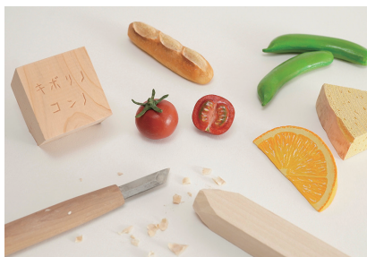
キボリノコンノ木彫り教室