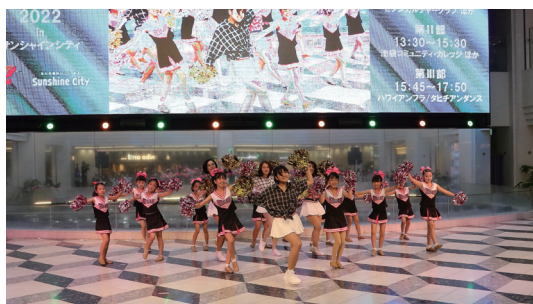
夏のダンスフェスティバル

多くのコート面数と細かいレベル分けにより、参加者一人ひとりがテニスを楽しく学べます。ゲーム練習の他、新しいショットの習得、苦手克服など、初めての方でも安心して楽しめるキャンプです。