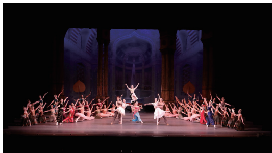
フライング・ダンシング

メゾンカルチャークラブ17店舗と池袋コミュニティ・カレッジの店舗ネットワークを活かした旬の講座開発により、同じ趣味や目的を持った仲間と知的好奇心を満たし、心の充足を得られる体験の場を提供しています。また店舗合同の発表会やイベントを定期的に行い、日ごろの成果を発揮いただく機会を通して元気あるスクールを目指していきます。