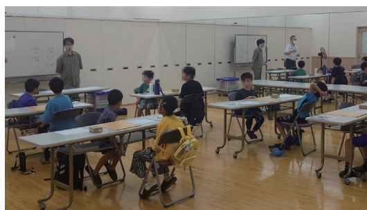
子ども将棋交流戦

茶道・香道の各流派合同の茶会を毎年秋に東京・護国寺で開催しています。日頃のお点前の成果を披露します。(過去43回開催)