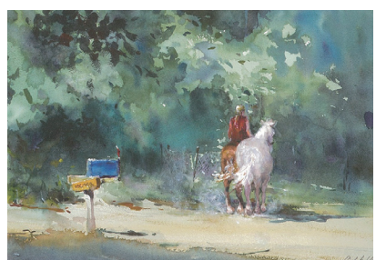
右近としこの透明水彩