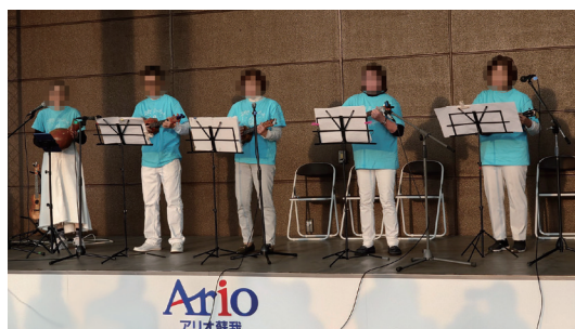
ダンス・音楽発表会

毎年8月に池袋サンシャインシティ地下1階「噴水広場」で開催しています。池袋コミュニティ・カレッジとメゾンカルチャークラブの受講生の他、一般団体も参加する大型イベントです。