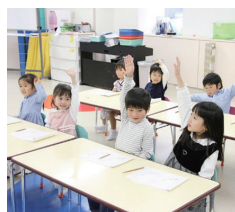
理英会アフタースクール池袋校