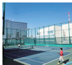
屋上テニスコート